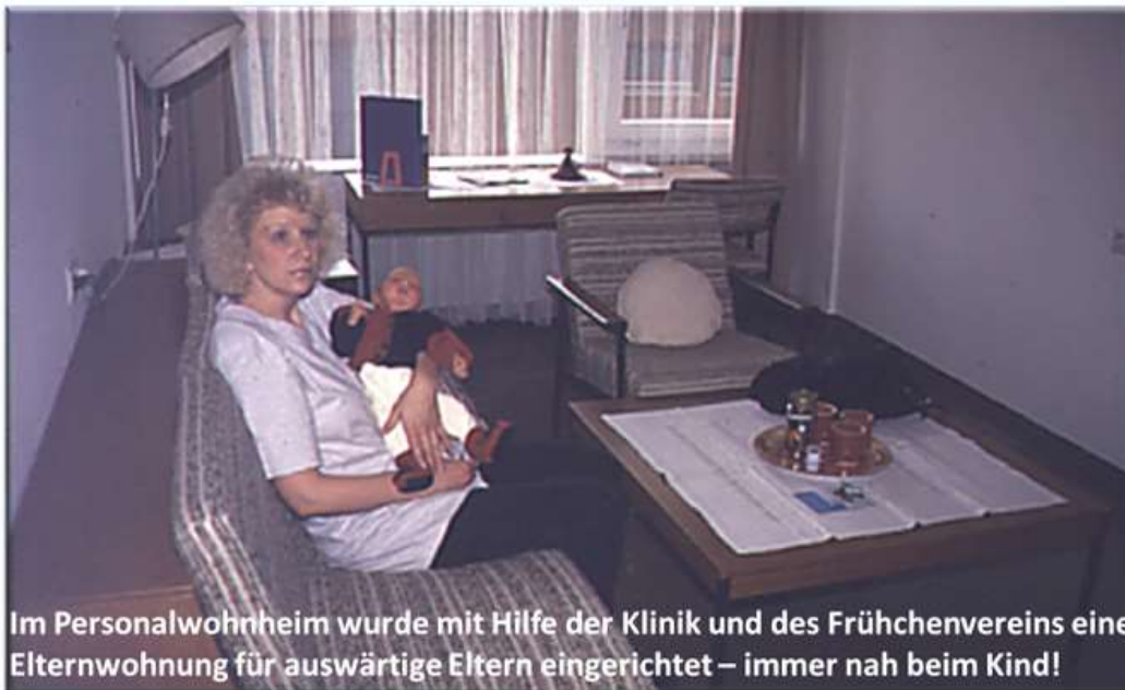
Im Personalwohnheim wurde mit Hilfe der Klinik und des Frühchenvereins eine Elternwohnung für auswärtige Eltern eingerichtet – immer nah beim Kind!

Vor 22 Jahren wurde 1998 wurde mit Unterstützung von Frühchen e.V. eine Elternwohnung im Klinikum am Steinenberg eingerichtet. Verschiedene Modernisierungsmaßnahmen und Neuanschaffungen wurden von uns auch ganz aktuell finanziell unterstützt.